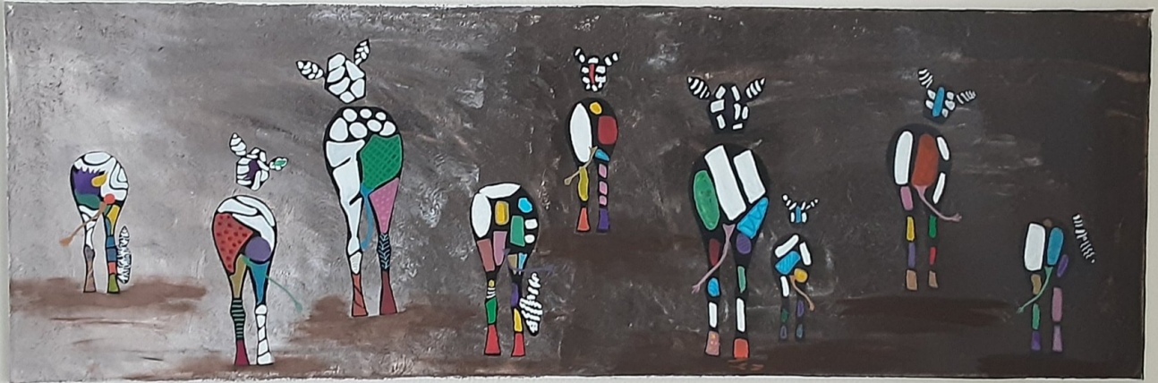
Tableau " Les zèbres "

Notre toile est terminée, "Les zèbres" que vous pouvez admirer dans la salle à manger.