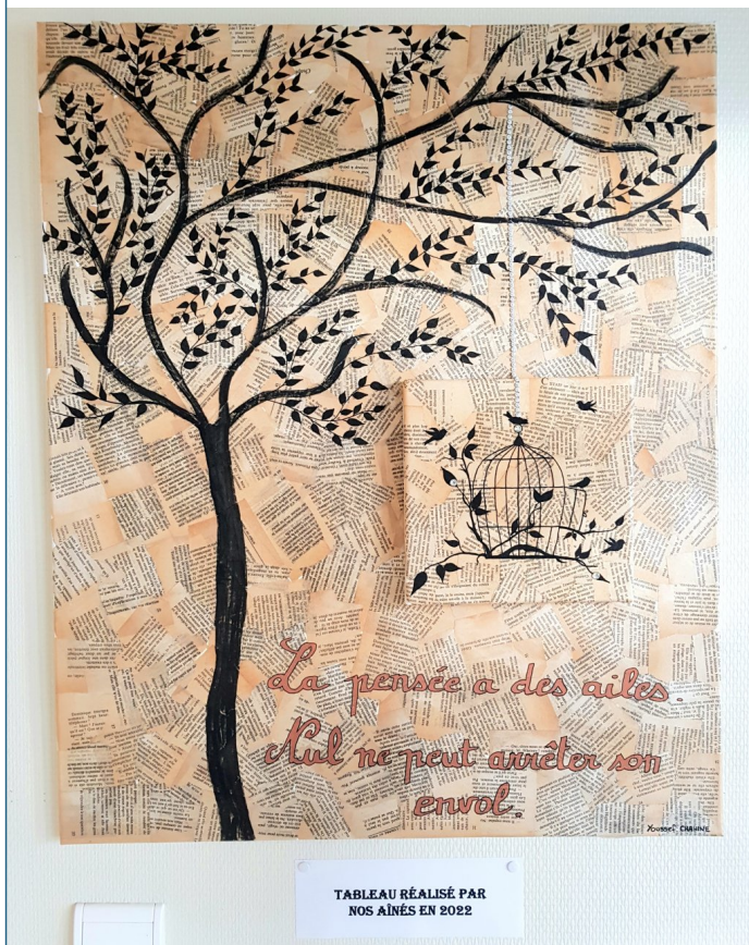
Tableau réalisé par nos aînés, en recyclant des pages de livres déchirées et collées sur une toile à peindre, avec une magnifique citation de Youssef CHAHINE.