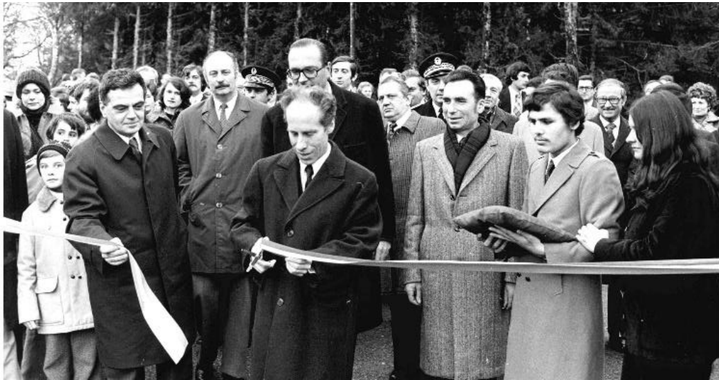
Inauguration des Tamaris en 1975

Le 23 octobre 1971 est créée l'Association des Centres Éducatifs de Haute-Corrèze. Les premiers centres sont Peyrelevade, Bort-les-Orgues et Sornac en 1974. De nombreux autres établissements sur d'autres communes suivent. Jacques Chirac, alors premier ministre, met en œuvre avec le ministre de la santé, Gérard Lenoir, la loi du 30 juin 1975 sur les institutions sociales et médico-sociales qui, aujourd'hui encore, fait foi.