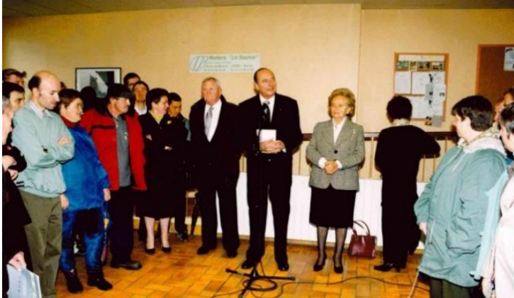
Dernière visite aux Tamaris de Jacques Chirac, alors Président de la République, entouré de son épouse Bernadette et de sa fille Claude.

Dans le cadre des buts qu'elle s'est fixés, la Fondation répond en priorité aux besoins des personnes handicapées résidant en Limousin. Par sa spécificité, et les moyens mis en œuvre, elle est de nature à répondre aux besoins de personnes résidant dans toutes les régions de France.