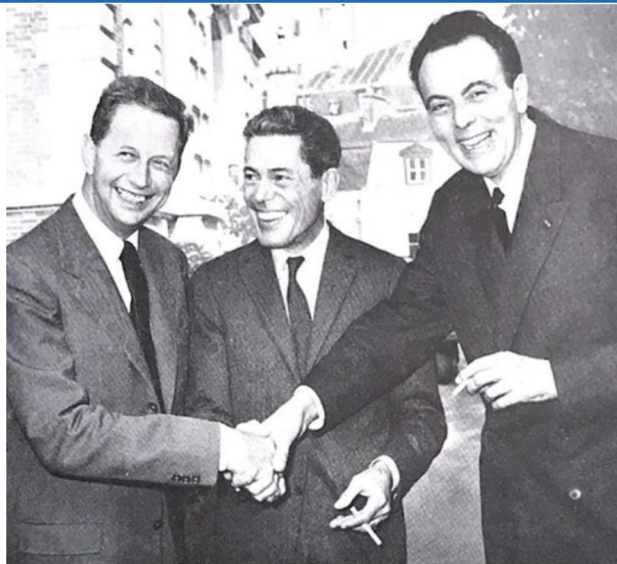
Les Professeurs André Lwoff, Jacques Monod et François Jacob, Prix Nobel de Médecine 1965 Présidents du Comité d'Honneur du Mouvement Français pour le Planning Familial